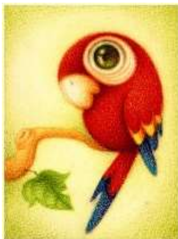
Рисунок 1 - Попугай